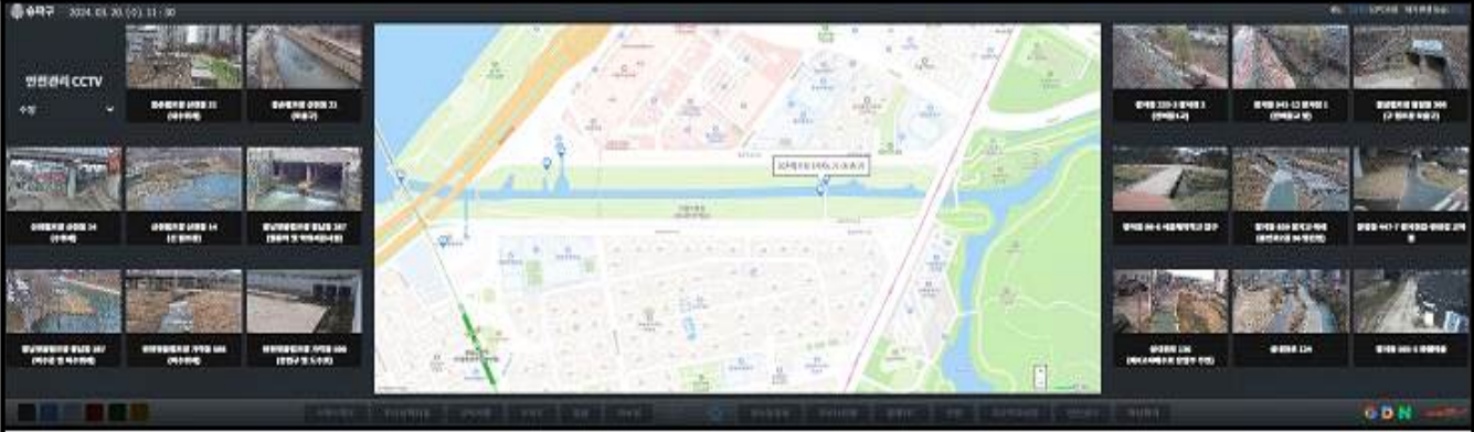
스마트 주민 구청장실 메인화면