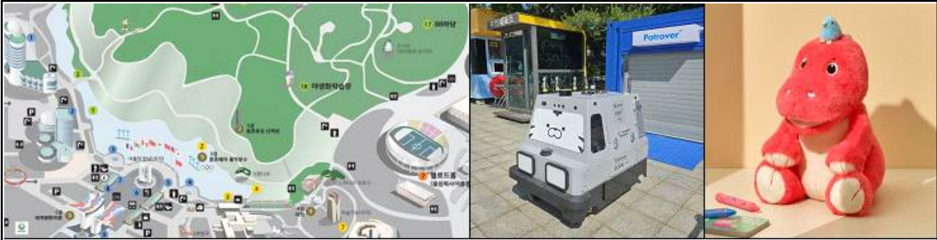
인공지능(AI)기반 로봇 운영