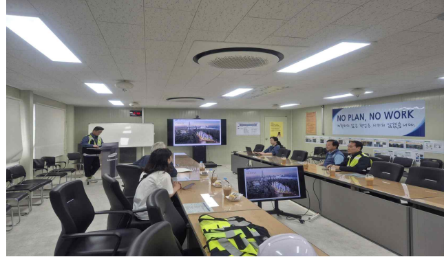
2024.05.30. 공사현장 공정회의(미성크로바)