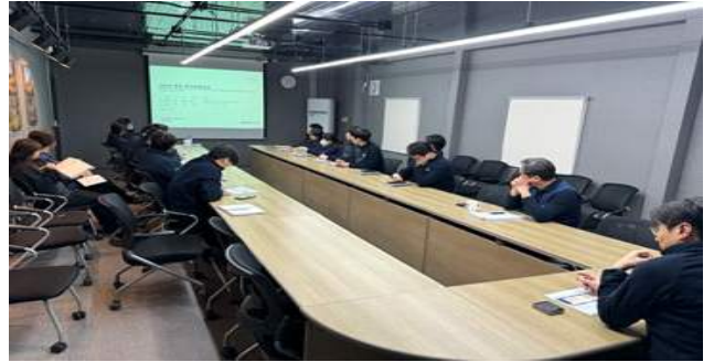
2024.03.15. 공사현장 공청회의(문정동 136일원)