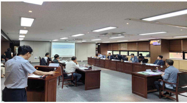
2023.06.20. 송파구 주택정비사업 자문위원회 개최