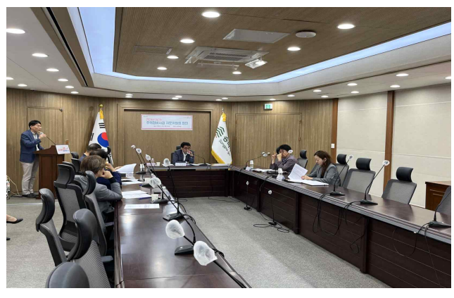
2024.05.30. 송파구 주택정비사업 자문위원회 개최 (송파구 고성능 공동주택 건설계획)