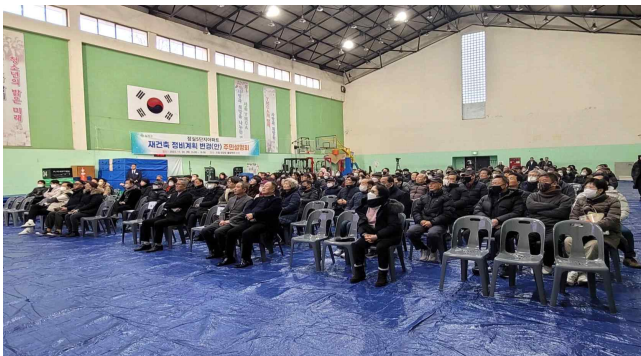
2023.11.30. 잠실5단지 정비계획 변경 주민설명회 개최