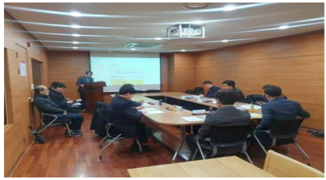
2024.01.09. 거여동 46번지 일원 신속통합기획 재개발사업 신청관련 주택정비사업 자문위원회