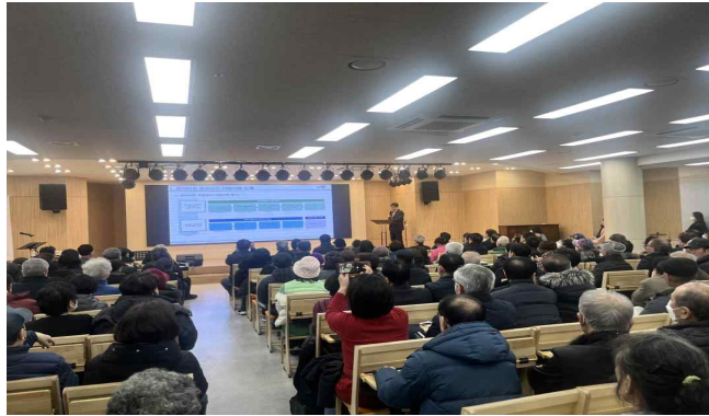
2024.01.18. 풍남동 모아타운 관리계획 수립 관련 주민설명회 개최(2차)