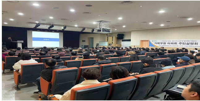
2024.02.28. 가락우창아파트 정비계획 수립 주민설명회