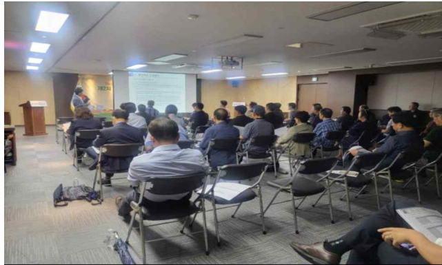
2023.07.14. 송파구 재건축·재개발 등 정비사업 조합장 및 임원 교육 개최