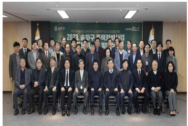
2023.03.09. 송파구 주택정비사업 자문위원회 발대식 개최