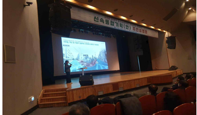
2024.02.07. 마천2구역 신속통합기획(안) 주민설명회