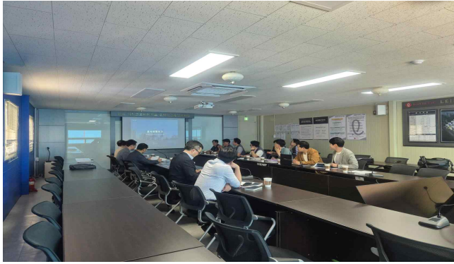
2024.05.30. 공사현장 공정회의(잠실진주)