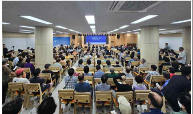
2023.07.20. 풍납동 모아타운 주민설명회 개최