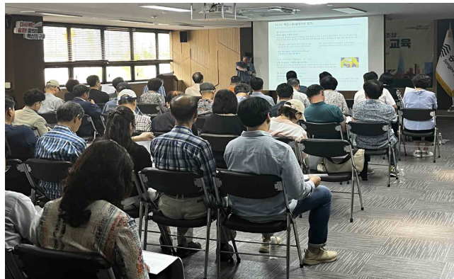
2023.09.11. 송파구 재건축·재개발 등 정비사업 조합장 및 임원 교육 개최