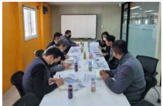
2022.11.30. 공사현장 공정회의