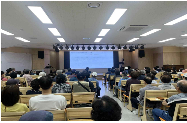
2024.05.28. 풍납동 모아타운 관리계획 고시 관련 주민설명회 개최(2차)