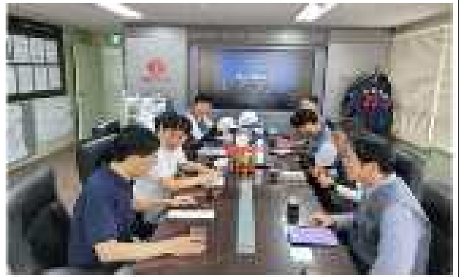
2023.09.13. 공사현장 공정회의(미성크로바)