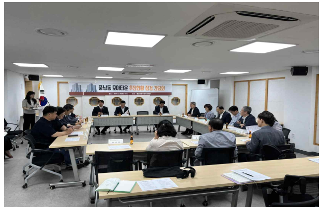
2024.05.28. 모아타운 추진현황 점검 간담회(풍남동)