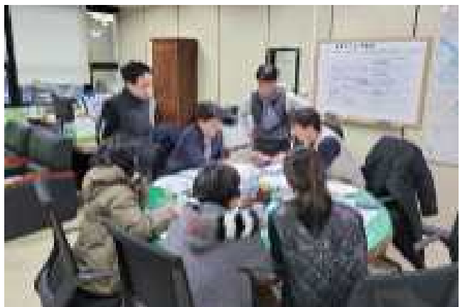
2023.02.24. 민간협력기구 운영