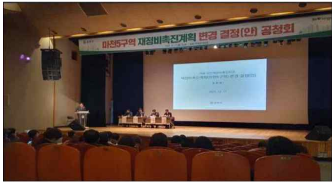
2023.12.11. 마천5구역 재정비촉진계획 변경 수립관련 공청회 개최