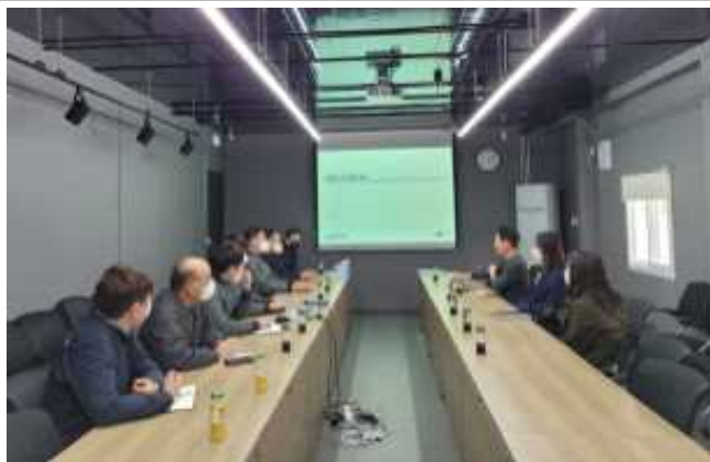
2022.11.07. 공사현장 공정회의