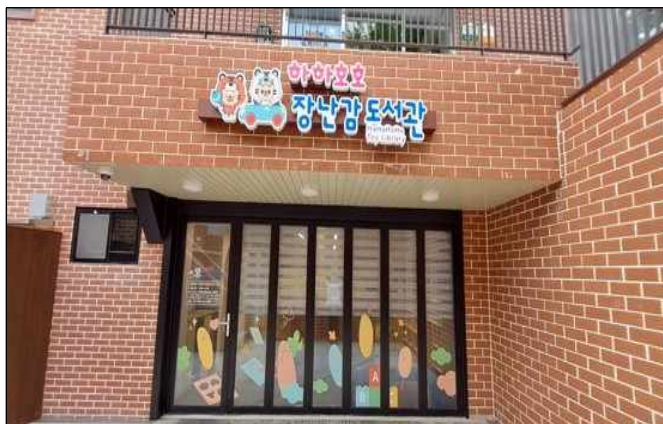
【 잠실점 】